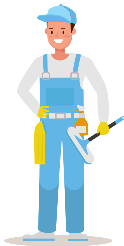
בעלי שכר נמוך מהממוצע