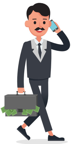
בעלי שכר גבוהה מהממוצע